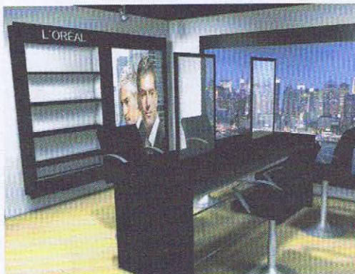
Et af Abildgaard Designs nyeste projekter-oplæg til en frisørsalon for firmaet L'Oréal Professional Products.